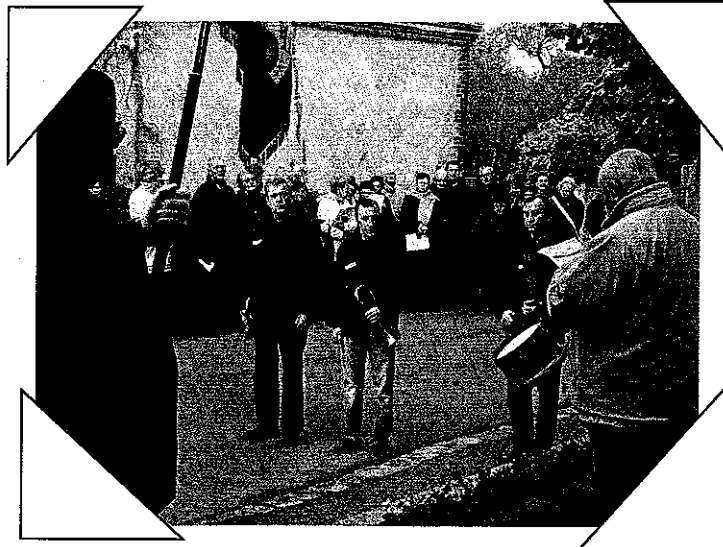
Forte participation de 70 personnes à la 91 e Cérémonie du 11 Novembre

La Mairie est ouverte les : LUNDI de 14h à 15 h JEUDI de 17h à 19 h